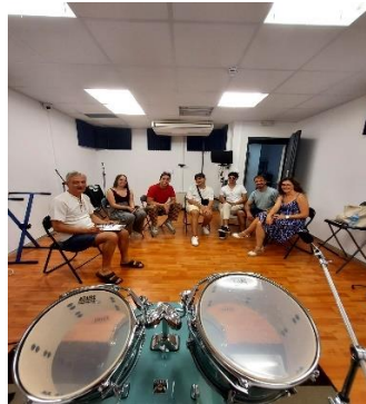
Músics dels Bucs