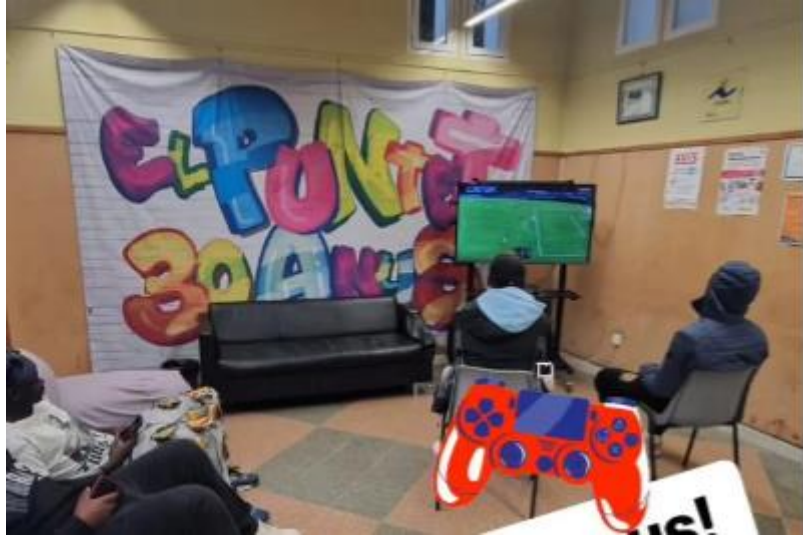
Estrena comandaments Play Station