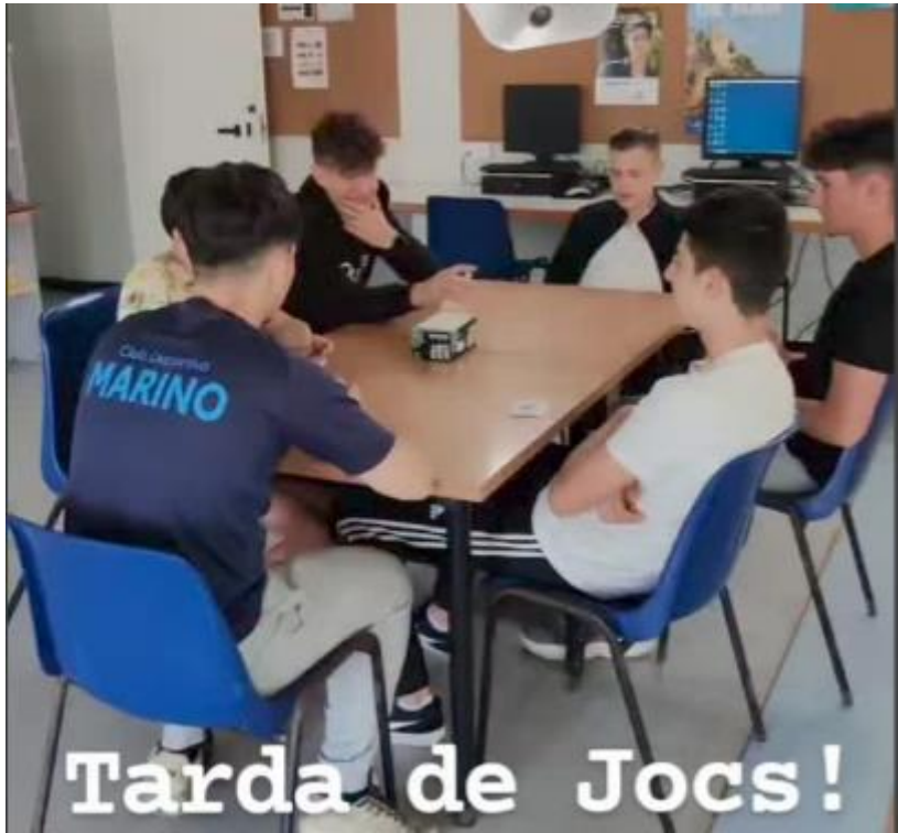
Tarda de Jocs