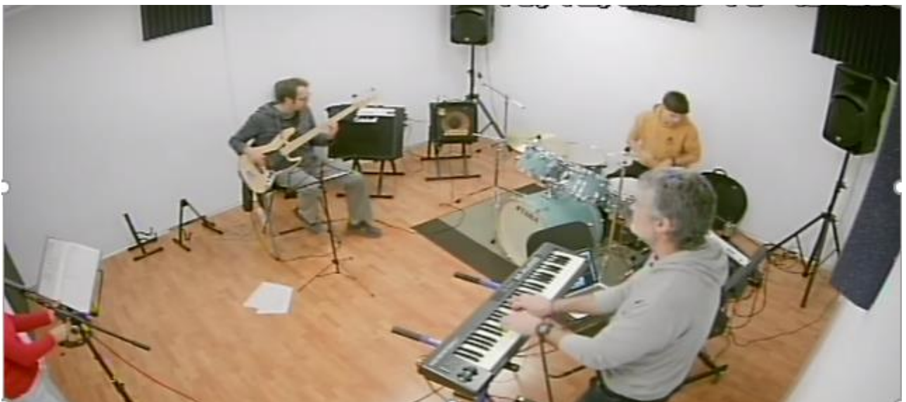
Assasig del grup Mangrooves

En l'annex núm. 2 podem veure la memòria entregada per l'empresa encarregada de la seva supervisió amb més dades.