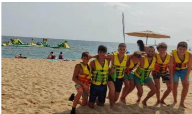
Activitat als inflables

Els dimecres per la tarda és el dia triat per a fer les activitats. El monitor d'el Puntet de Fenals proposa diferents activitats esportives i durant una hora i mitja amb els joves que s'hagin apuntat, es desplacen fins el lloc triat i fan l'activitat triada. Tot i que el pàdel és l'activitat més triada, també hem anat a córrer, fer bàsquet, volei-platja, banys a la platja, els inflables de la platja, entre d'altres. 24 són els joves que han participat en alguna de les activitats proposades ja sigui per nosaltres o per ells mateixos. Més detall en annex núm 3.