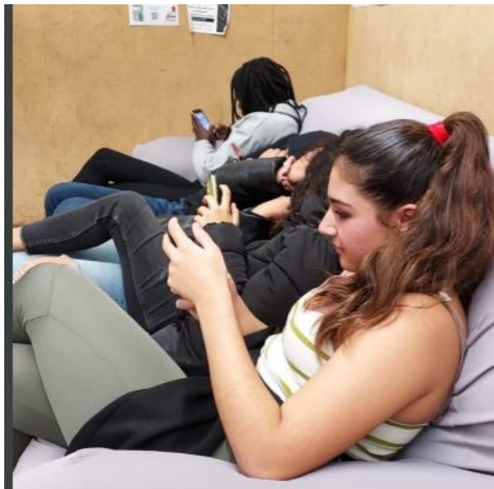
Una tarda a El Puntet.