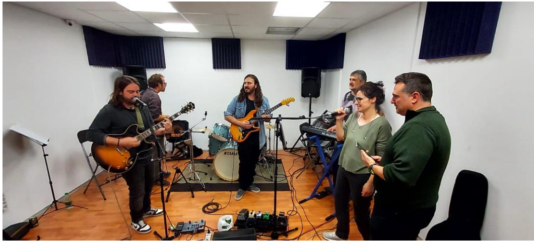
La Jam d'Els Bucs