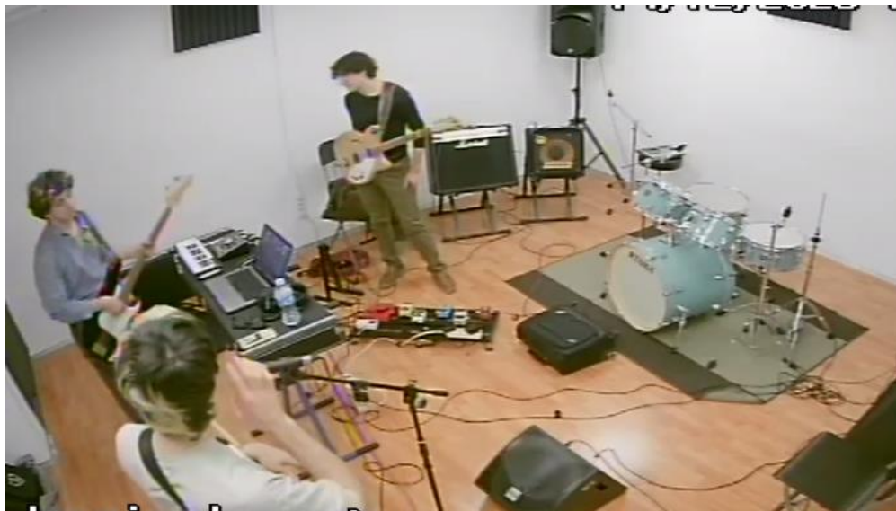
Assaig de Barbosa