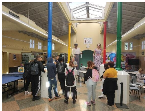
Xerrada alumnes PTT