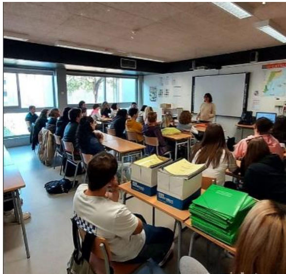
Presentació del curs de monitors

*La primera xifra correspon a les persones inscrites i la segona el màxim de places possibles.