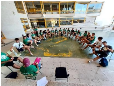
Monitors Casal d'Estiu

En fons groc , aquelles propostes que han generat un consens en tots i cadascuna de les entrevistes i grups de discussió.