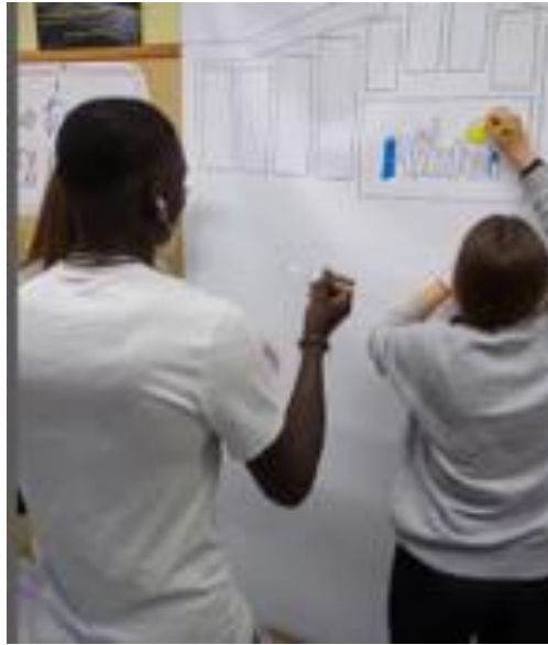
Espai d'expressió artística

En l'annex núm. 1 la memòria d'actuació presentada per l'empresa TOMBARELLA S.C. on hi figura més detalladament les activitats puntuals organitzades als dos equipaments conjuntament amb la secció de Joventut.