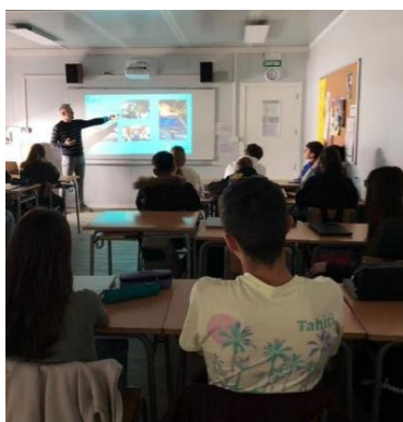
El Gran Germà digital