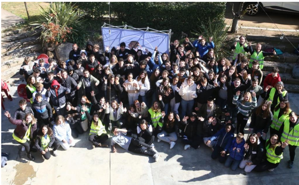
Foto de grup

A la trobada, els delegats i delegades es troben una sèrie de dinàmiques destinades a donar eines per a la seva tasca a l'aula. En el cas d'aquest any, la dinàmica es va relacionar amb un viatge en avió com a centre d'interès i fer-ho més amè. Paral·lelament els tutors/res també reben una petita formació en la que se'ls anima a empoderar i donar rellevància a la figura dels delegats/des.