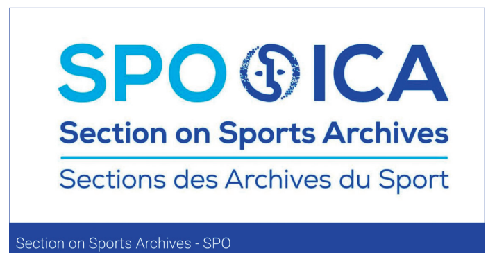
Logo identificatiu de la secció d'arxius esportius - SPO. Procedència: Consell Internacional d'Arxius - CIA/ICA.

L'ICA/SPO, és una de les tretze seccions internacionals que integren el Consell Internacional d'Arxius, ICA, organisme que fou creat el 9 de juny de 1948 sota els auspicis de la UNESCO. La secció d'Esports es creà a Viena l'any 2004, amb els objectius de conscienciar de la necessitat de preservar aquests fons vinculats amb el món esportiu, promoure'n la seva difusió i compartir el coneixement i les experiències identificades mitjançant seminaris, jornades, taules rodones, publicacions, entre d'altres.