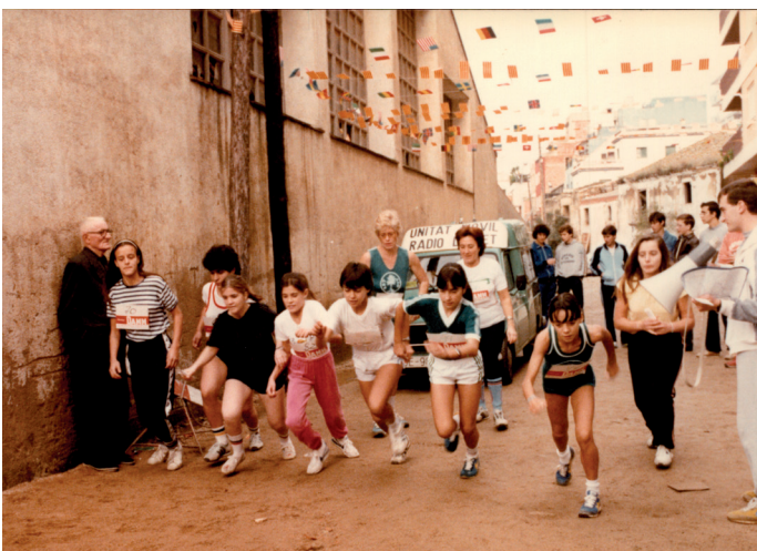
Noies participants en una cursa organitzada per la Penya Barcelonista de Lloret de Mar, en el marc dels actes del seu IX aniversari. Data: 1984. CID: 723.000.500_320.015.004.

Els documents generats per la pràctica de l'esport en seran l'evidència, preservem-los. ■