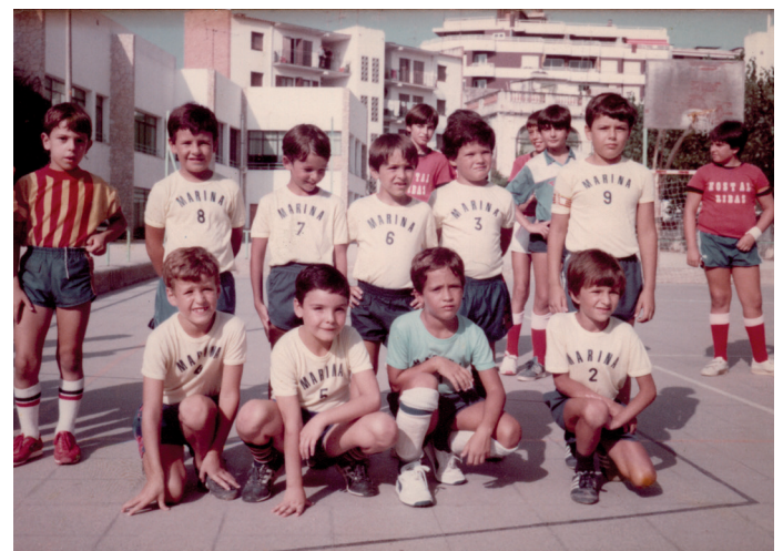
Equip de futbol infantil masculí que participa en el torneig celebrat a la pista de l'escola Esteve Carles organitzat per la Penya Barcelonista de Lloret de Mar. Data: 1982. CID: 723.000.500_320.015.001.