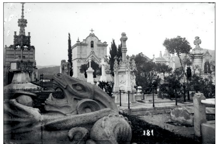
Hipogeus i Panteons al Cementiri Modernista de Lloret de Mar. 1920 ca ST: 302.019.017

En la família teixida al voltant del negoci propi, ens trobem que els seus membres queden separats pel mar, ja siguin els homes pilots, comerciants, controlant els establiments i interessos a Catalunya i a Amèrica.