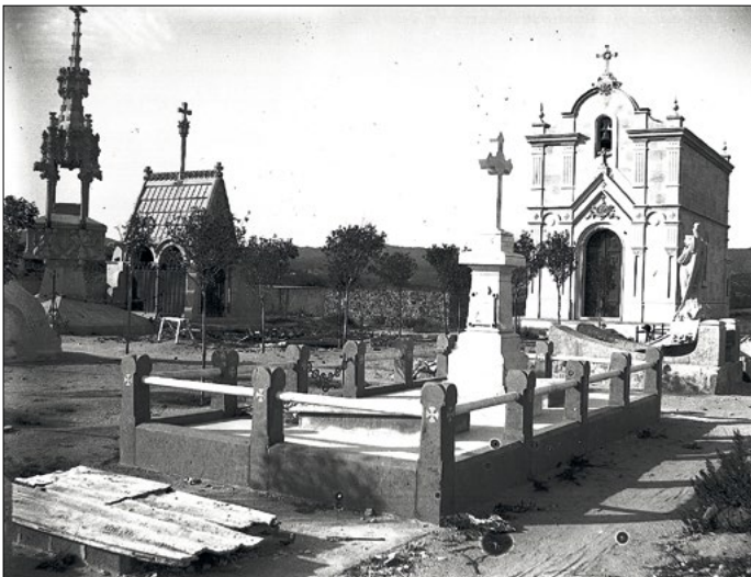
Construcció de panteons i hipogeus al Cementiri de Lloret de Mar. 1910 ca ST 320.001.12

En l'estudi que estic portant a terme, La vida de les dones que van deixar el seu llegat al cementiri , en podem destacar diverses particularitats. Podien ser solteres, casades o vídues. Eren, com es pot suposar, de famílies benestants, amb marits pilots, comerciants, rendistes, propietaris, hisendats o de professions liberals. Podien viure a Lloret o venir-hi a estiuejar.