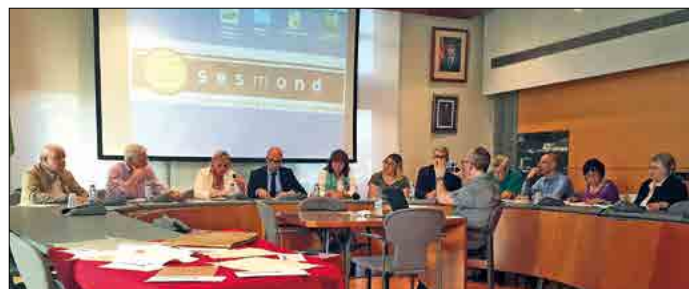
Acte de presentació del butlletí Sesmond i de cessió del fons Taulina.

Durant l'acte també es va fer la cerimònia de signatura de cessió del fons de la família Taulina. Representant la