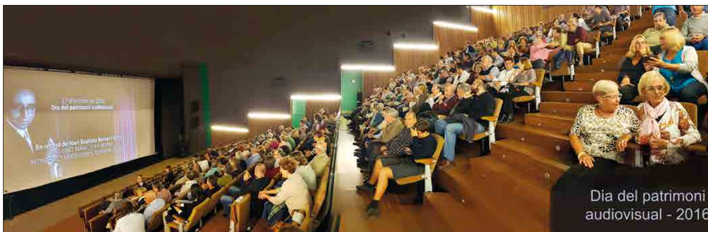
Assistents a l'acte del Dia Mundial del Patrimoni Audiovisual.

Enguany el web del SAMLM ha experimentat grans canvis: d'una banda, se n'ha millorat l'entorn i, de l'altra, la navegació s'ha fet més fluida.