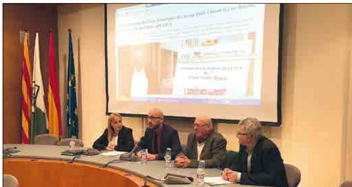
Acte de cessió del fons d'imatges de Josep Valls – Bambi –.

Els ponents van destacar la gran importància de la cessió d'aquest fons per a Lloret de Mar, format per unes 50.000 fotografies classificades per temes, tot recordant que aquestes fotografies retraten molt fidelment la nostra vila, la seva gent i les persones que la visitaven a l'estiu durant el boom del turisme.