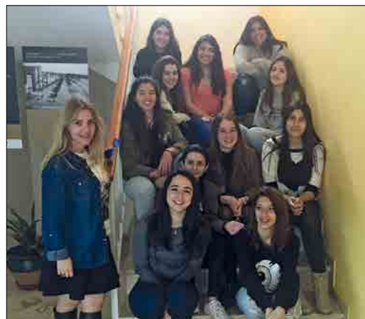
Les alumnes de quart d'ESO del Col·legi de la Immaculada Concepció que ens van visitar el dia 13 de maig.

D'altra banda, el 13 de maig una quinzena d'alumnes de quart d'ESO del Col·legi de la Immaculada Concepció van venir a conèixer l'arxiu. Se'ls va mostrar una sèrie de documents que els havien d'ajudar a redactar el seu crèdit de síntesi, sobre l'origen del Ball de Plaça i sobre els indians de Lloret del segle XIX.