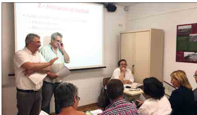
Taller de genealogia celebrat el Dia Internacional dels Arxius.