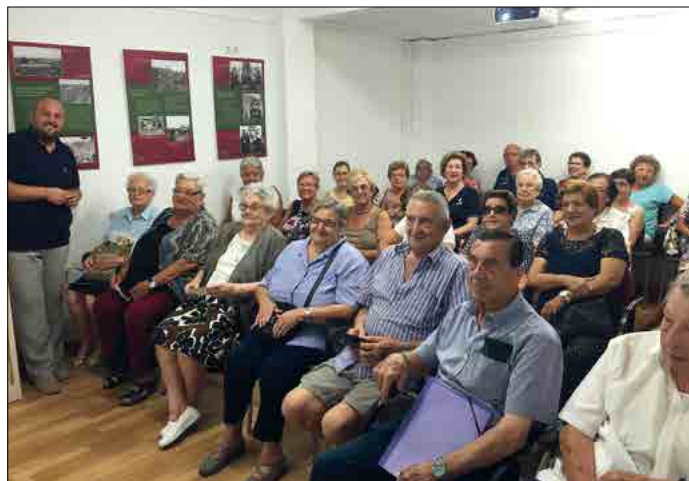
Sessió del Grup d'Amics de l'Arxiu.

El nombre màxim de persones que han coincidint durant una sessió ha estat de 37. Des del SAMLM volem agrair a tots els membres del Grup d'Amics de l'Arxiu la seva col·laboració desinteressada que, sens dubte, contribueix a la preservació de la memòria històrica de bona part del segle XX a la nostra vila.