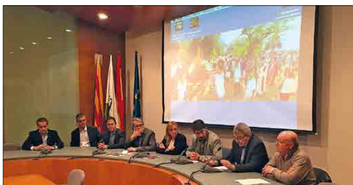
Acte de cessió en dipòsit del fons de l'Obreria de Santa Cristina. Procedència: SAMLM (M. Assumpció Comas)

Durant l'acte es va efectuar la projecció d'una sèrie de projeccions audiovisuals relacionades amb Santa Cristina