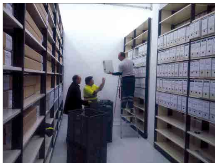
Procés de trasllat de la documentació de l'antic Arxiu Administratiu a les noves dependències de l'antiga plaça de braus.

El trasllat, que implicà el desplaçament d'unes 8.000 capses d'arxiu, equivalents a uns 900 metres lineals de documentació, va començar el 15 de febrer de 2016, amb el desmuntatge de les prestatgeries del dipòsit de l'avinguda de les Alegries, que gradualment es van anar muntant de bell nou en el dipòsit de les dependències situades a l'antiga plaça de braus. A mesura que s'anaven instal·lant les prestatgeries a les noves dependències s'hi anaven col·locant les capses de documentació administrativa i, posteriorment, es va dur a terme el trasllat del mobiliari i el material d'oficina. Com a conseqüència del trasllat, l'Arxiu va haver de suspendre temporalment les consultes i reproduccions de documentació.