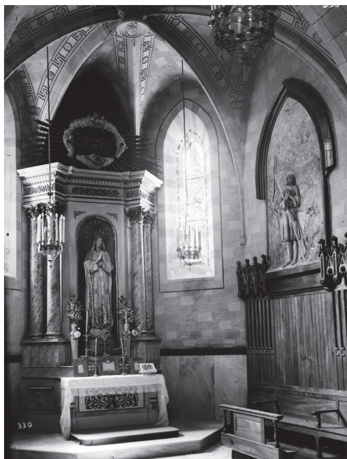
Capella de la Concepció de l’església parroquial de Sant Romà, de la qual en tenia cura la família Sala.

No deixa de sorprendre que ella patís la violència que detalla, doncs eren cosins germans, es coneixien de ben petits i havien viscut a prop abans de casar-se i quan ella es refugiava a casa de la seva mare —que era tia d’ell—,