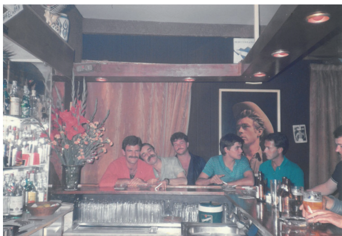
Clients i amics del bar La Tortuga del carrer de Santa Teresa. Data: 1982. PC.

Si durant els anys seixanta els bars d'ambient assumien les seves activitats amb discreció, això va canviar amb la mort de Franco l'any 1975. La seva mort suposà l'inici d'una major llibertat d'expressió i d'actuació en molts àmbits, però sobretot per als homosexuals. Si bé és cert que l'any 1970 s'havia aprovat la Llei de Perillositat i Rehabilitació Social 5 que categoritzava als homosexuals com a perillosos socials, incrementant-se així les batudes policials als locals d'ambient de les capitals, Lloret no se'n va veure gaire afectat com a conseqüència de l'interès econòmic que suscitava el turisme. A més, els propietaris acostumaven a evitar tot incident que podria haver donat motius per a tancar els seus locals. Tan propietaris com clients habituals ens han assegurat que el tràfic de drogues estava totalment prohibit dins dels locals, encara que el consum de haixix i