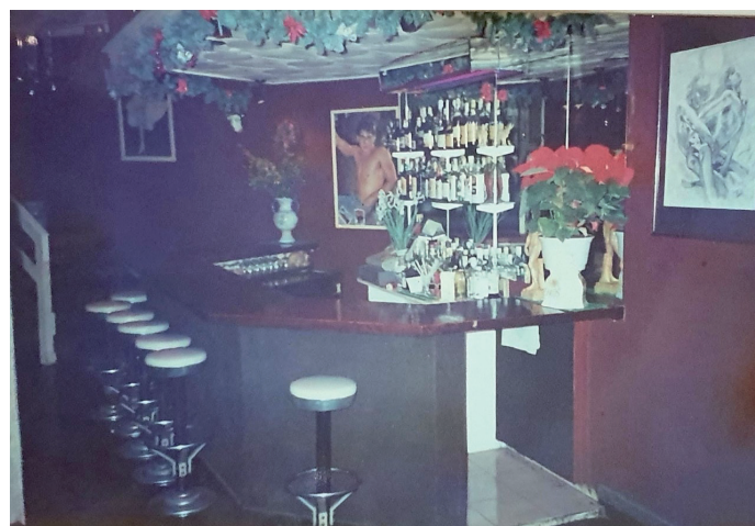
Interior del bar El David , al carrer Migdia, durant les festes de Nadal. Data: 1985. PC.