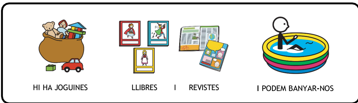
HI HA JOGUINES