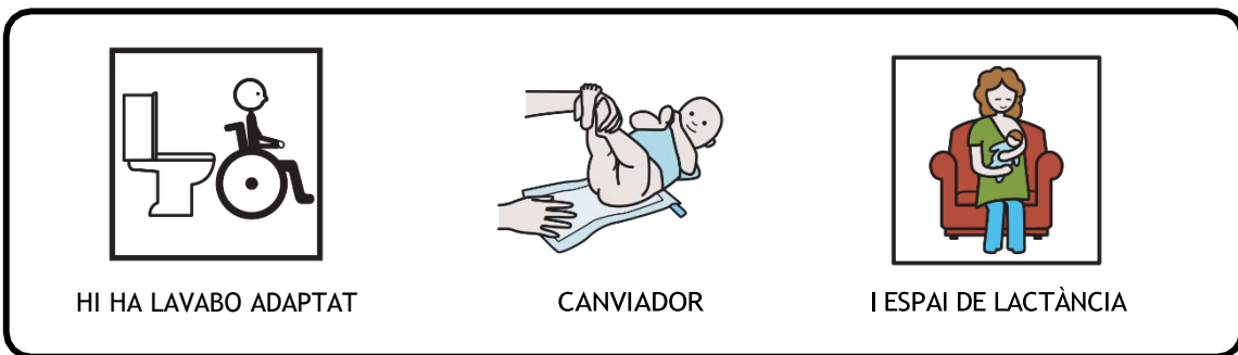
HI HA LAVABO ADAPTAT