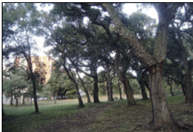
El Parc de Can Xardó s'ha desbrossat, i s'hi han instal·lat bancs i papereres.