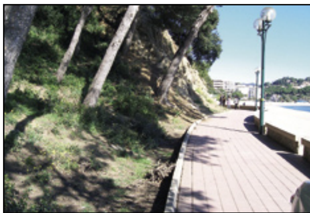
En els boscos de Fenals s'hi marcaran itineraris perquè tothom pugui gaudir dels miradors que hi ha en el turó.