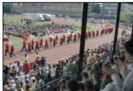
L'entrega i la valentia dels esportistes és l'autèntic esperit dels Jocs Special Olympics.