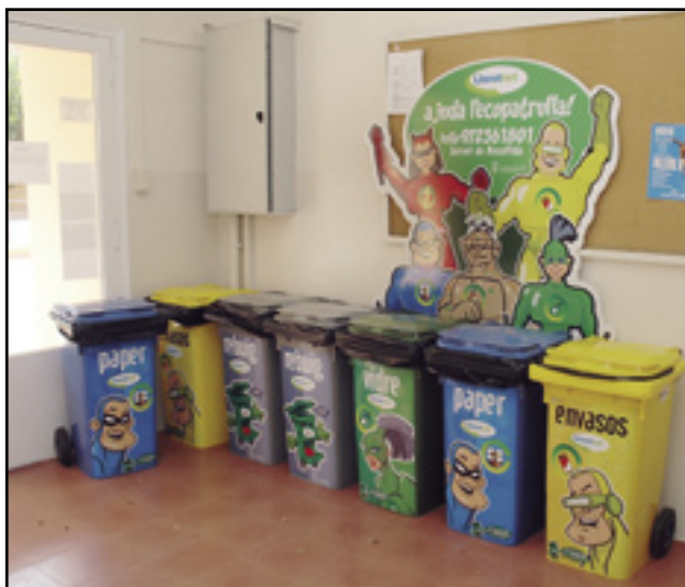
Aquests són els contenidors especials que s'han instal·lat a les aules, vigilats per l'Ecopatrulla.

La campanya es representa amb els 5 superherois, representant cadascun d'ells, una fracció valoritzable de residu: Paper i cartró, envasos lleugers, vidre, matèria orgànica, piles i bateries.